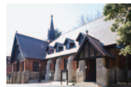
明治学院チャペル